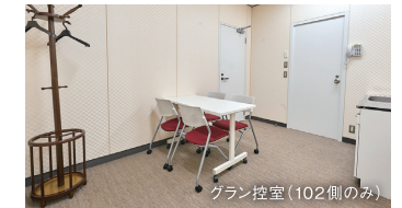
グラン控室(102側のみ)